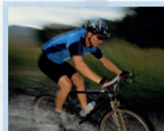
Freizeitmöglichkeiten in Langenberg

Das Hotel carpe diem öffnete im August 2009 seine Forten in Velbert-Langenberg. In zentraler Lage, nur wenige Gehminuten zur historischen Altstadt, bieten bergische Fachwerk- und Schieferfassaden, kleine verwinkelte Gassen und Gründerzeitvillen einen einzigartigen Charme zum Wohlfühlen für Kurzurlauber und Geschäftsleute.